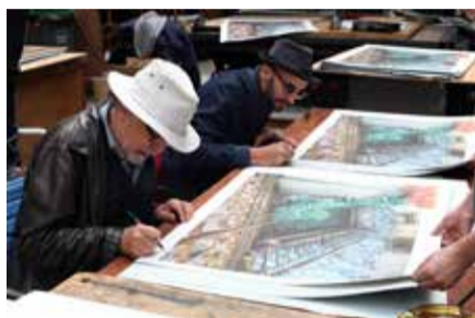
© JR x Art Spiegelman - Ghosts of Ellis Island, IDEM