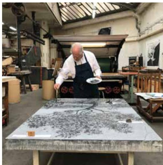
© William Kentridge III - October 12, 2021, IDEM